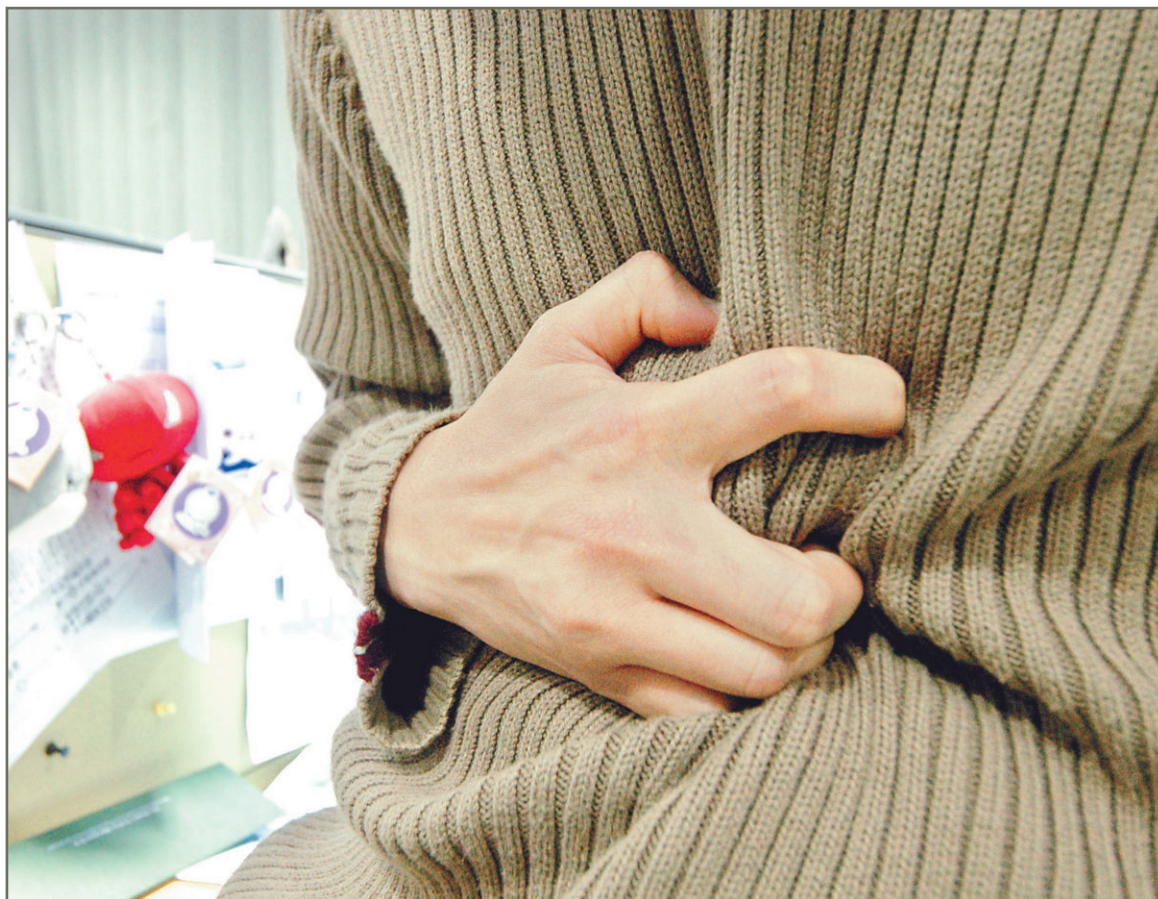
上班人士經常喝咖啡或吸煙提神，導致胃部不適，可能會引致胃食道反流性疾病。

病均是由生理原因引起，單靠改變生活習慣是難以減輕胃食道反流性疾病的病況。患者須接受藥物治療，以減輕病情。然而藥物治療並不能根治胃食道反流性疾病，如停止服用藥物，便有可能復發。