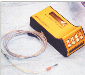
胃酸監察器(左)及流動胃酸記錄儀。

質子泵抑制劑是胃食道反流性疾病的最新治療方法。胃黏膜內有逾百萬個的獨特細胞，這些細胞透過胃酸泵製造胃酸，消化食物。質子泵抑制劑能停止部分胃酸泵的運作，控制胃酸的產量，減低胃酸倒流入食道導致胸口灼熱的機會。