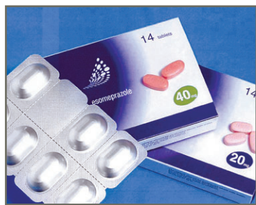
胃食道返流疾病患者，須以藥物治療減輕病情，但服藥不可將疾病根治。