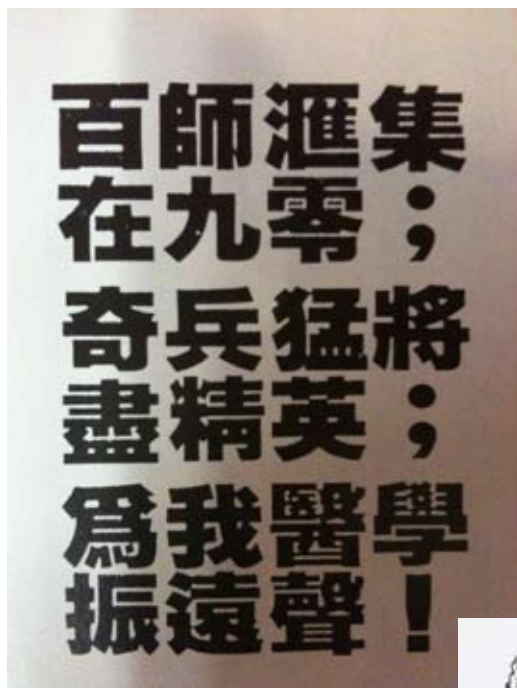
Elixir 圖片 九三班